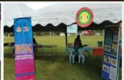
KARNIVAL SAMBUTAN MAAL HIJRAH 1438H 15 OKTOBER 2016 ANJURAN MDCH