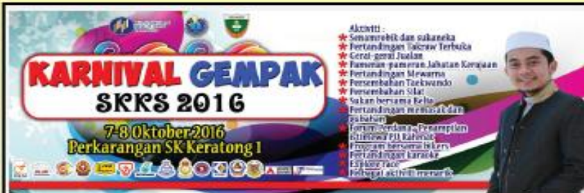
KARNIVAL GEMPAK SKKS 2016 | FELDA KERATONG 1 7-8 OKTOBER 2016