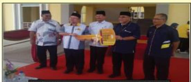
Majlis Penyerahan bangunan MRS Bera