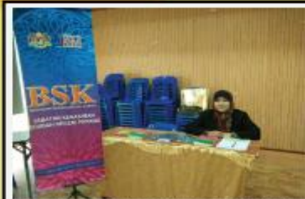
IDEAL WOMEN CONVENTION UMP GAMBANG 16 HINGGA 17 OKTOBER 2016 ANJURAN UMP