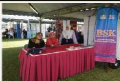
KARNIVAL BENTONG 2 HINGGA 3 SEPTEMBER 2016 ANJURAN MDB