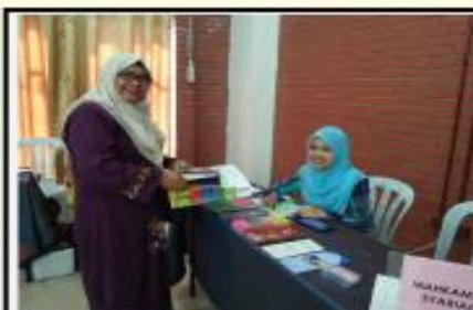
MINI KARNIVAL WANITA BIDADARI SYURGA 27 SEPTEMBER 2016 ANJURAN JAIP