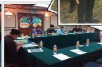
Muzakarah Kehakiman Bil 2/2016 bertempat di De Rh. Beach Resort, Kuantan,