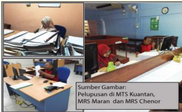
Sumber Gambar: Pelupusan di MTS Kuantan, MRS Maran dan MRS Chenor

Pelupusan tahun 2016 adalah lebih tertumpu kepada fail-fail am dan dokumen kewangan. Kesemua fail di daerah-daerah ni berjumlah 376 buah (Am) dan 17.68 m/p (kewangan) telah dilupuskan dengan kaedah bakar, tanam dan rincih. Prosedur pelupusan rekod adalah berdasarkan Jadual Pelupusan Rekod Urusan Am, Jadual Pelupusan Rekod Kewangan Dan Perakaunan serta Akta Arkib Negara Malaysia 2003 (Akta 629). Kebenaran untuk pelupusan fail am dan kewangan ini telah mendapat kelulusan dari Arkib Negara Malaysia, Pejabat Kewangan dan Perbendaharaan Negeri serta Jabatan Audit Negara.