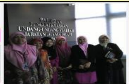
KUNJUNGAN HORMAT BSK KE BAHAGIAN PENGUATKUASA JAIP 16 JUN 2016