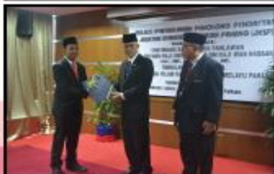
PENERIMA TAUHIAH PENOLONG PENDAFTAR JKSP 2016