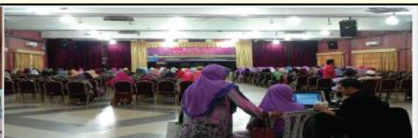
MINI KARNIVAL WANITA BIDADARI SYURGA 27 SEPTEMBER 2016 (2) ANJURAN JAIP

Sepanjang tahun 2016, Seksyen Bahagian Sokongan Keluarga (SBSK) Jabatan Kehakiman Syariah Pahang (JKSP) telah menyertai pelbagai program anjuran agensi kerajaan di negeri Pahang. Peluang ini sangat bermakna bagi memberi pendedahan maklumat kepada kakitangan awam khususnya dan masyarakat amnya, berkaitan fungsi BSK itu sendiri dalam menguatkuasakan perintah mahkamah. Selain edaran pamflet, khidmat nasihat dan perundangan juga diberi kepada mereka. Semoga SBSK JKSP akan terus giat aktif dalam aktiviti-aktiviti akan datang. Motifnya tidak lain tidak bukan adalah untuk membantu golongan wanita yang teraniaya terutamanya yang melibatkan isu nafkah.