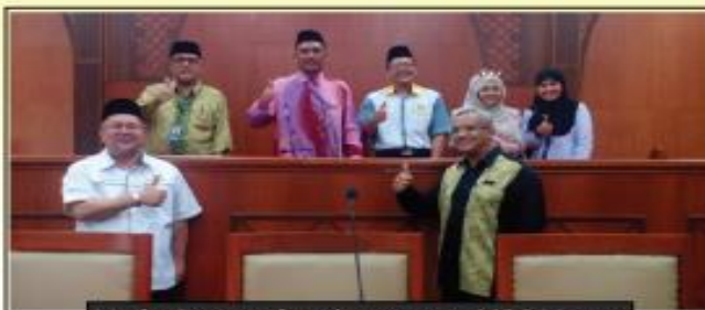
Majlis Penyerahan bangunan MRS Maran